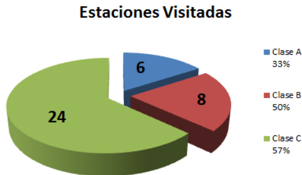
Gráfico N°1 Estaciones de Bomberos Visitadas AI por Clase