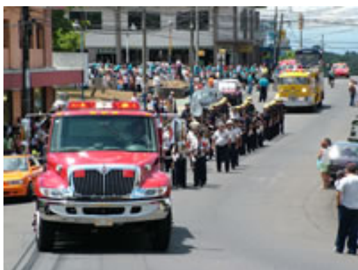
Sarchí, 35 Años 30/04/06

A continuación algunas fotografías de lo que se vivió en esas celebraciones.