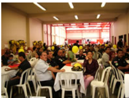
Cartago, 55 Años 21/05/06