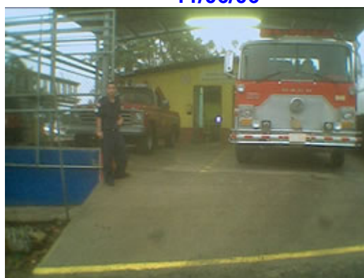
Acosta, 5 Años 28/05/06

En la próxima edición fotos de los aniversarios de las estaciones de Pavas (15 años) y Orotina (25 años) y de la Inauguración de la Estación de Coronado.